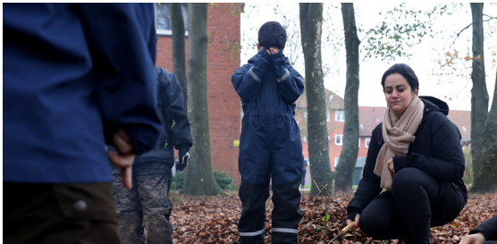
Naturdag i Sydvest

Og så er det vigtigt, at der er tale om nye fællesskaber. Idéen er ikke at facilitere samvær for grupper, der ses i forvejen.