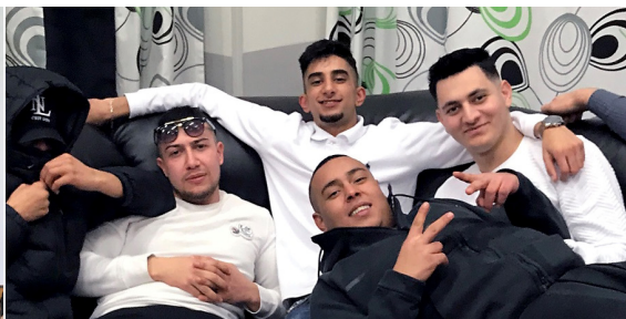
Temaforløb med Klub 18+