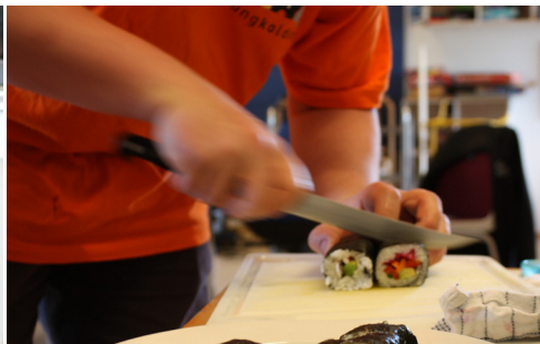
Fællesspisning i Skovparken