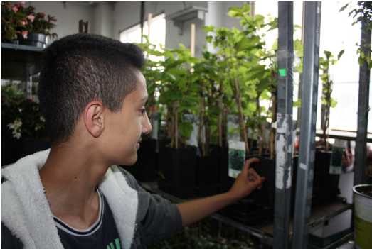
Fritidsjob hos Jensens Blomster

De fleste hænger godt ved. Alle er velopdragne, og jeg oplever stor fleksibilitet fra dem. Jeg har også et godt forhold til deres forældre, som kommer fra mange forskellige lande. Det er spændende at opleve de mange forskellige kulturer. Vi smager eksempelvis en masse forskellig mad, som de unge eller forældrene kommer med.