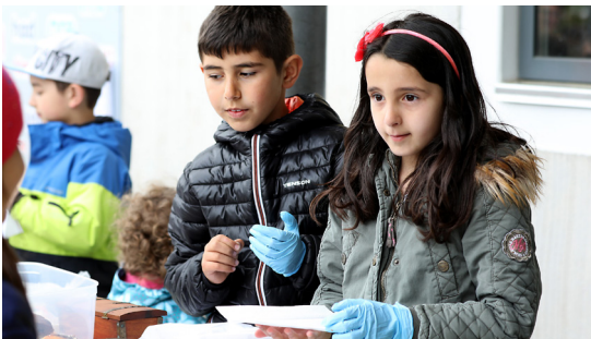
Markedsdag i Munkebo

ByLivKolding bidrager med lokaler, koordinering, mandskab og midler, og projektet foregår primært i Skovparken/Skovvejen-kvarteret og kvarteret ved Munkebo, men gælder også de øvrige boligområder i helhedsplanen.