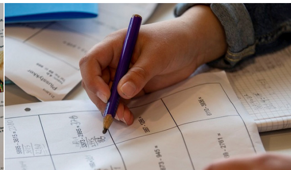
Lektiecafé i Munkebo