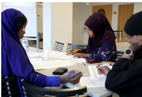
Undervisning i hverdagsøkonomi