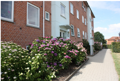
Tryghedsvandring i Brændkjær

Tryghedsvandringerne har gjort, at vi ved mere om, hvad der sker i boligområderne. Beboerne har fået sat ansigt på os, og vi har fået sat ansigt på mange af dem. Derfor tager de meget lettere fat i os, når der opstår problemer. Det er noget andet at ringe direkte til en politibetjent, man kender, end at sidde i kø til 114.