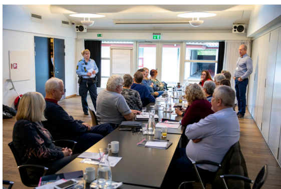
Tværfagligt forum på boligsociale indsatser på Kvarternetværksseminar 2019