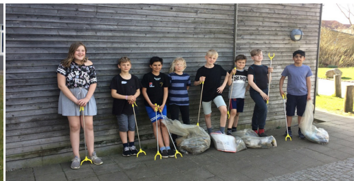
Lommepengeprojekt i Sydvest