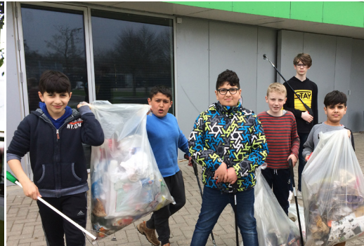
Lommeprojekt i Munkebo