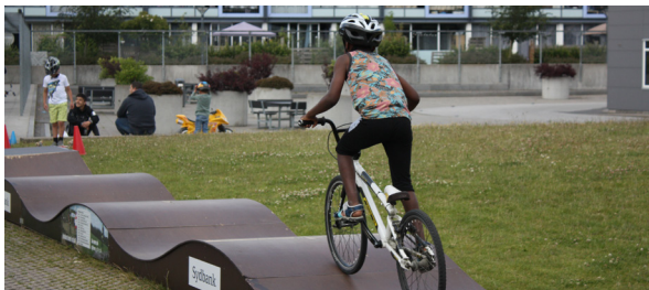
Cykelbane i Skovparken

Det blev et rigtigt godt projekt. Vi havde 12-14 børn i gang gennem tre uger, hvor de hjalp med at skære træer og buske ned, flytte sten, markere banen osv. Der var god stemning og en god energi. Og udover, at de får en udflugt som belønning for arbejdet, så er børnene også rigtig glade for at kunne bruge cykelbanen nu. Den er også blevet fed.