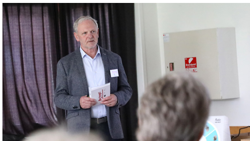
"Bo trygt" oplæg i Brændkjær

Temaforløbene strækker sig over 8 temaaftener og gennemføres i samarbejde med Ungekontakten og medarbejdere fra lokale klubber under Ungdomsskolen. I tilknytning til temaforløbene, Eat and Learn, afholder ByLivKolding og Ungekontakten arrangementer for forældrene til deltagerne i temaforløbene.