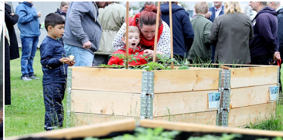
Byhaver i Rosenhaven