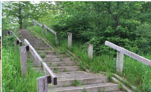
Tryghedsvandring i Skovparken